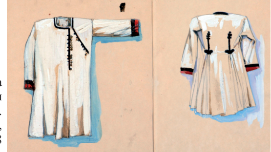
Эскиз костюма (верхней одежды мордвы). Бумага, акварель, карандаш. 40 × 28