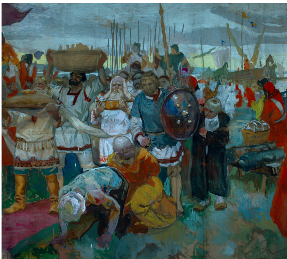
Картон с пленными татарами (вариант). Картон, гуашь. 244×300.

Вечер памяти художника В.А. Неясова на выставке в Зале искусств ЮУрГУ. 27 февраля 2008 г.