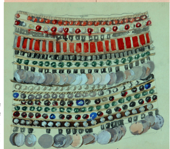
Нагрудное женское украшение. Бумага, акварель. 29 × 40,5