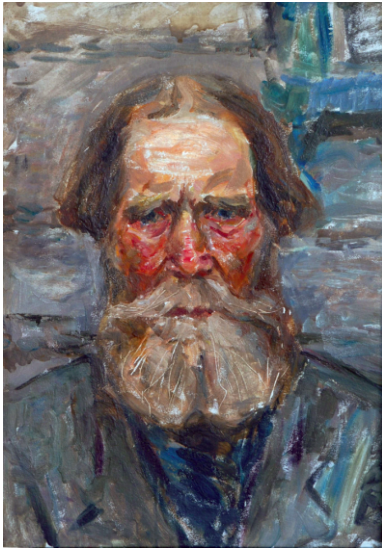
Дед Никита. Картон, масло. 49 × 34