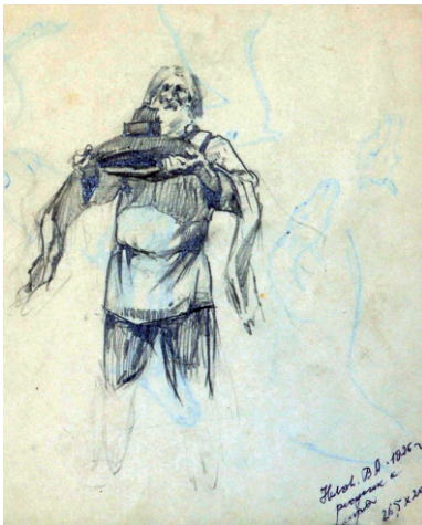
Набросок фигуры старейшины. Бумага, карандаш. 26,5 × 20