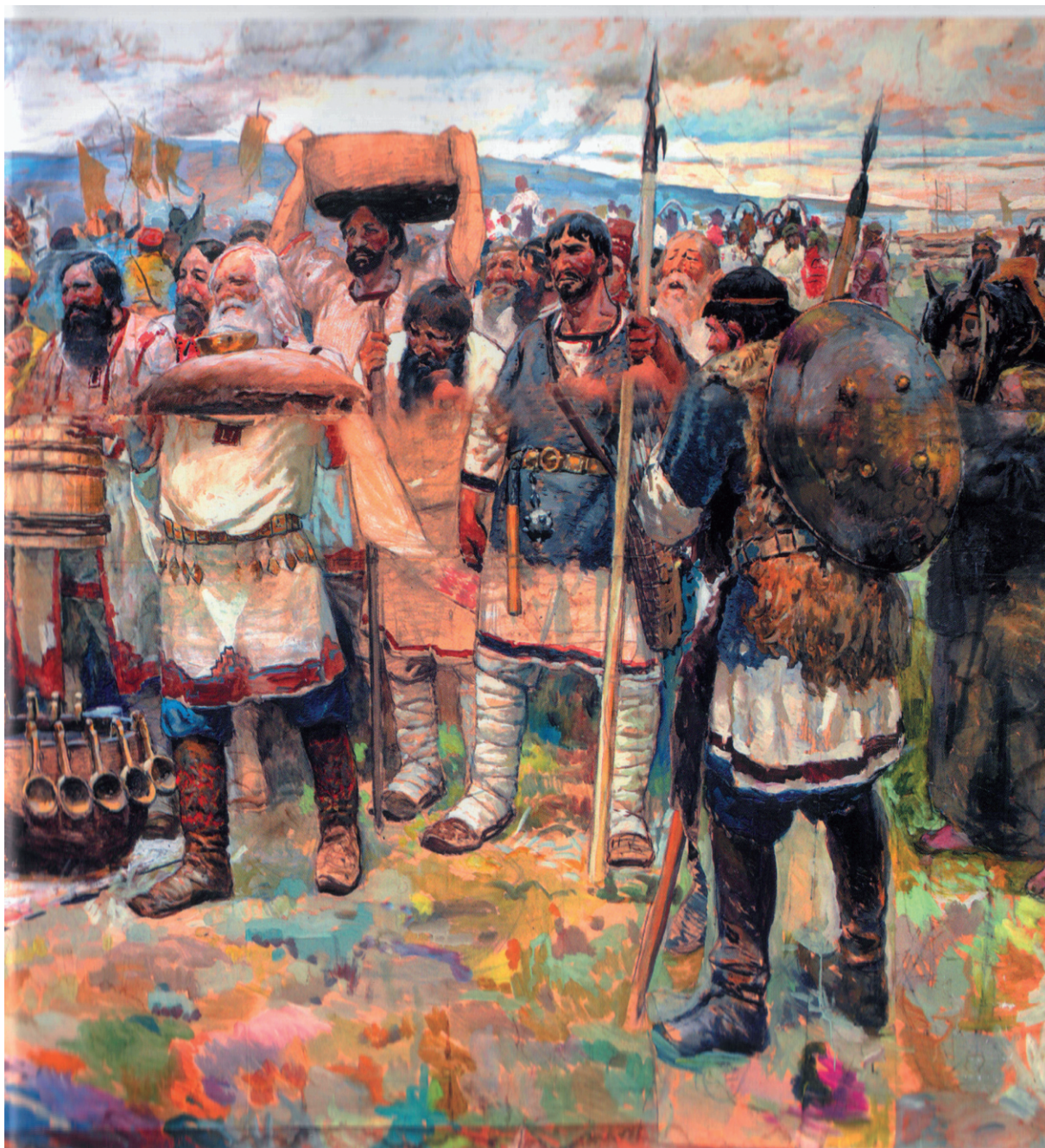
Воссоединение волжских народов с Россией. Картон к картине. Окончательный вариант. Бумага, уголь, акварель, гуашь. 1947—1984.