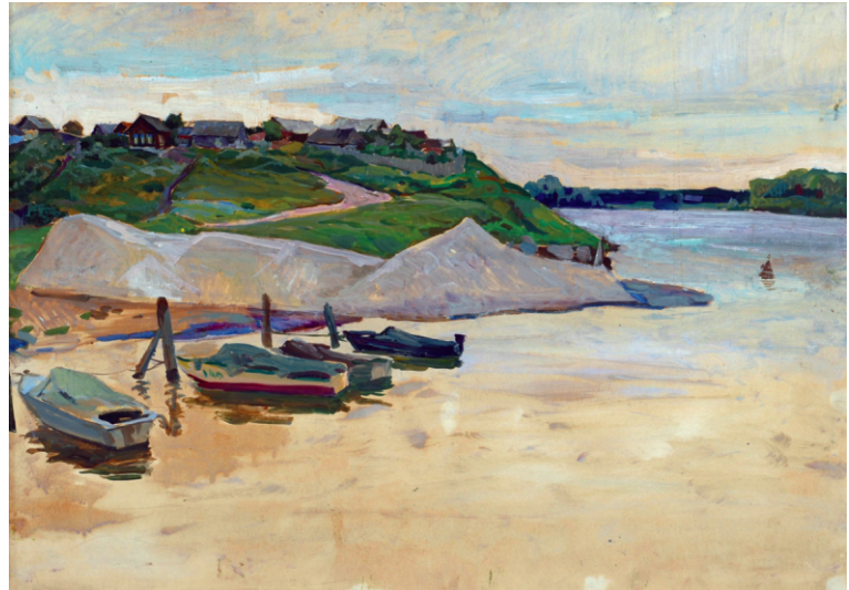
На Волге. Картон, масло. 61 × 86